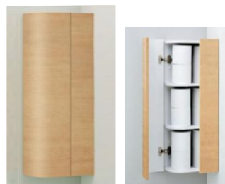
#NW1 ホワイト #ML ミルベージュ #MW ダルブラウン