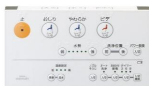
ウォシュレット用リモコン