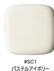
#SC1 パステルアイボリー